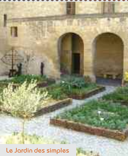
Le Jardin des simples