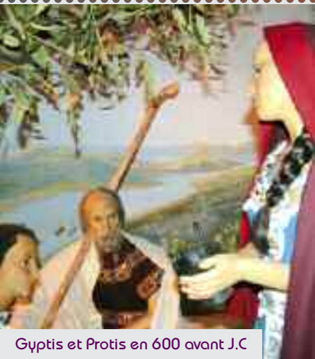
Gyptis et Protis en 600 avant J.C