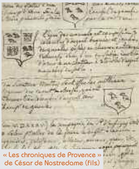
« Les chroniques de Provence » de César de Nostredame (fils)