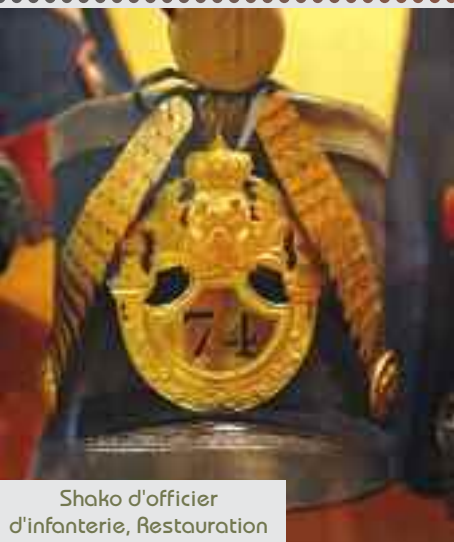
Shako d'officier d'infanterie, Restauration