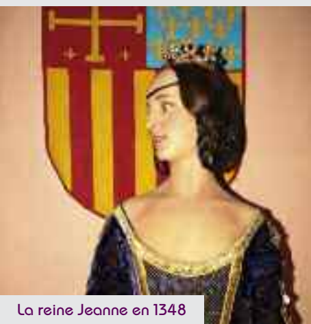
La reine Jeanne en 1348