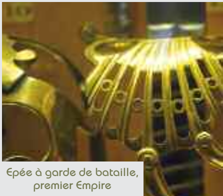
Épée à garde de bataille, premier Empire