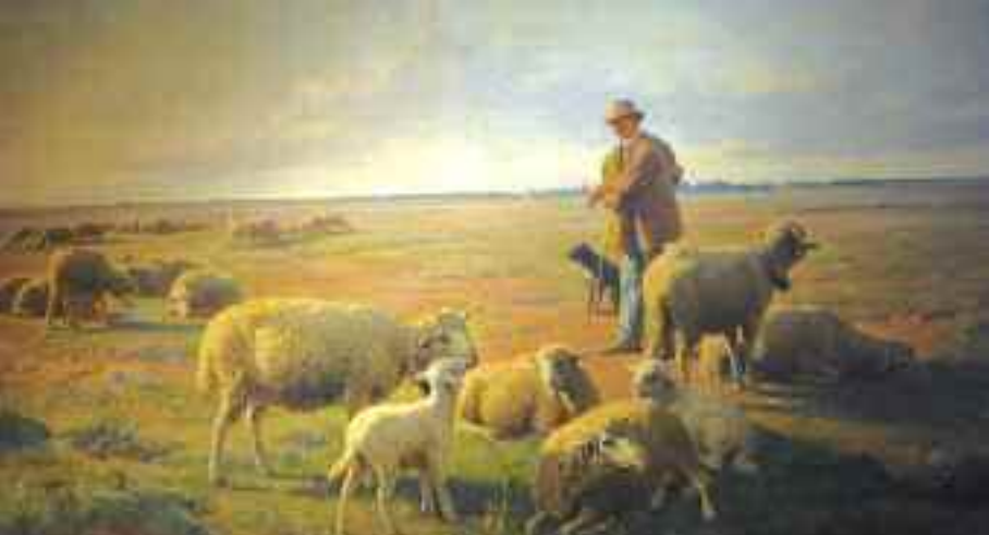
Berger et ses moutons dans la Crau d'Arles, 1894, huile sur toile, 146 x 196 cm