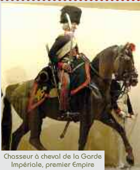
Chasseur à cheval de la Garde Impériale, premier Empire