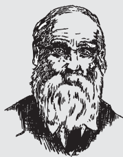
Parmi le cercle des poètes le "Félibre de Luseno" Antoine Blaise Crousillat

Né en 1814, ce jeune Salonais linguiste passe sa jeunesse à étudier la nature, à s'occuper de ses ruches en moulant des bougies de cire dans l'entreprise familiale de la fontaine moussue. Plus tard, devenu poète reconnu et membre du Félibrige (mouvement de réhabilitation littéraire de la langue et des traditions provençales, instauré en 1854 au château de Fontségugne), il participe pendant plus de vingt ans à l'élaboration du dictionnaire orthographique et grammatical de la langue provençale, le trésor du Félibrige aux côtés de son ami Mistral.