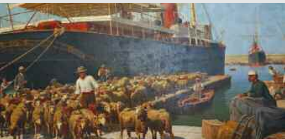
Paquebot débarquant ses moutons, Marseille, 1897, huile sur toile, 197 x 294 cm