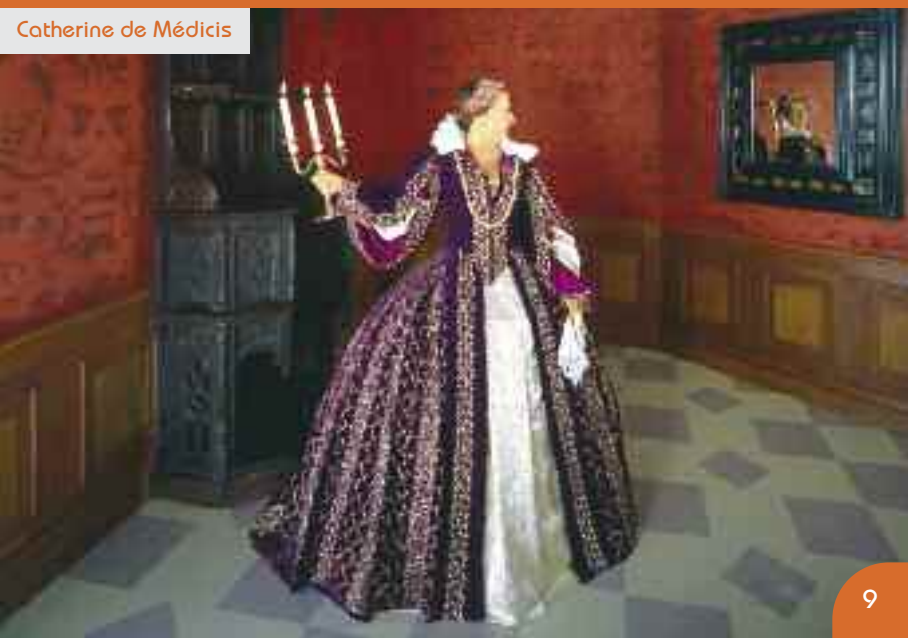
Catherine de Médicis