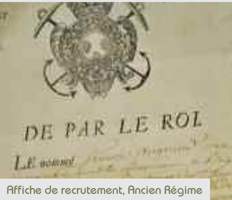
Affiche de recrutement, Ancien Régime