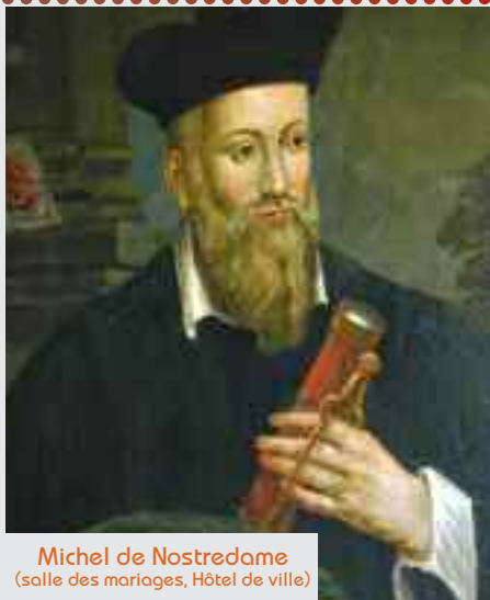
Michel de Nostredame (salle des mariages, Hôtel de ville)