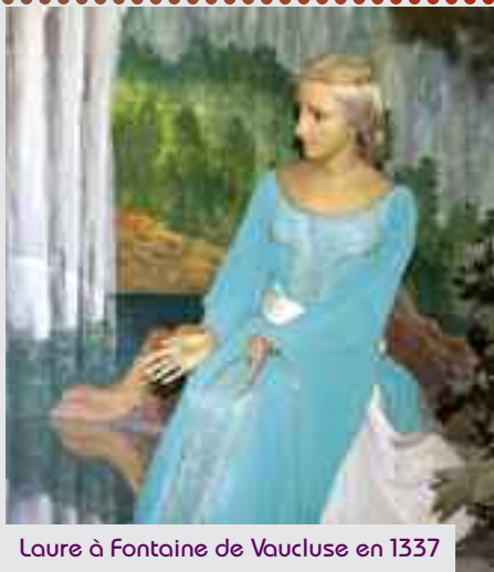
Laure à Fontaine de Vaucluse en 1337