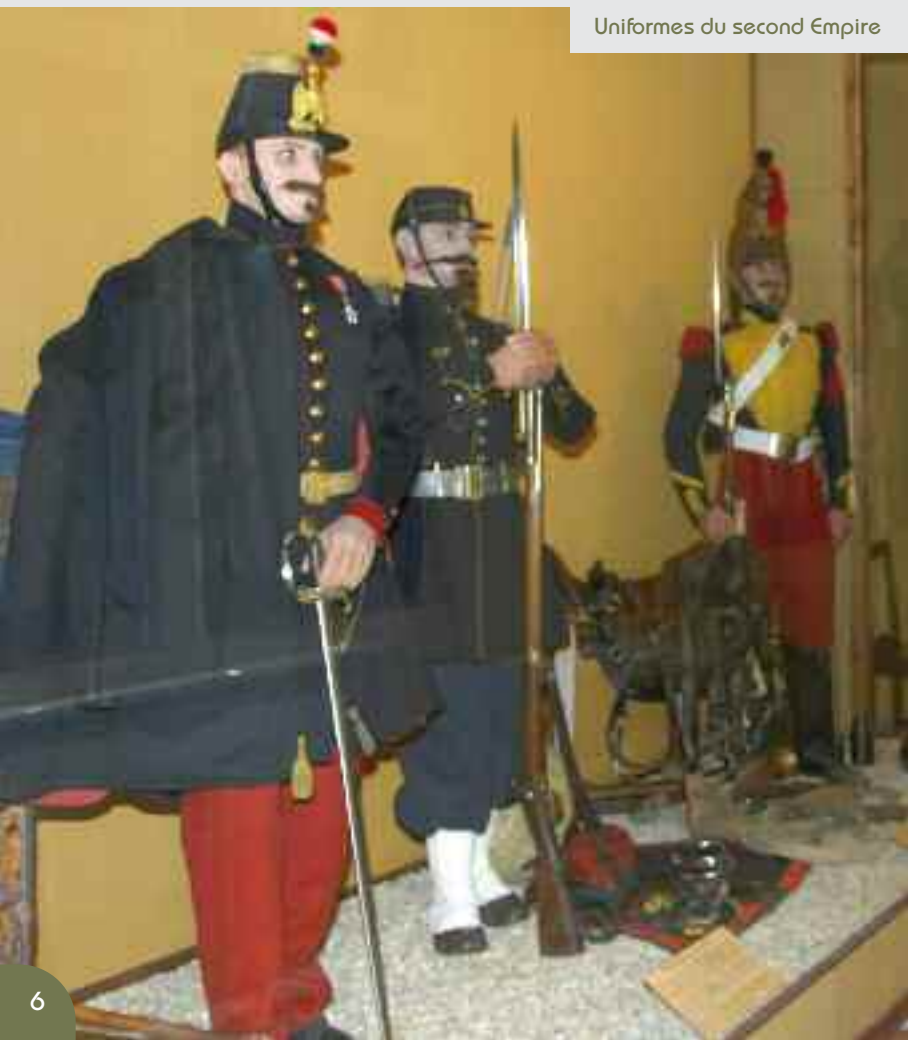
Uniformes du second Empire

En début de visite 5 salles introductives guident le visiteur à travers l'histoire du château, celle des armes à feu françaises et présentent l'évolution du costume militaire sur les deux derniers siècles.