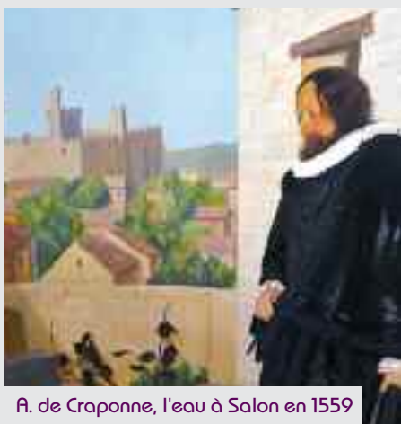
A. de Craonne, l'eau à Salon en 1559

« Poudès vesita aqueste museon e escouta la meloudio de la lengo provençalo, lengo dóu brès de Frederi Mistral. La vilo de Seloun de Crau se fai ounour d'aculi au siéu lou Coungrès dóu Felibrige, o la Santo-Estello de 2009. »