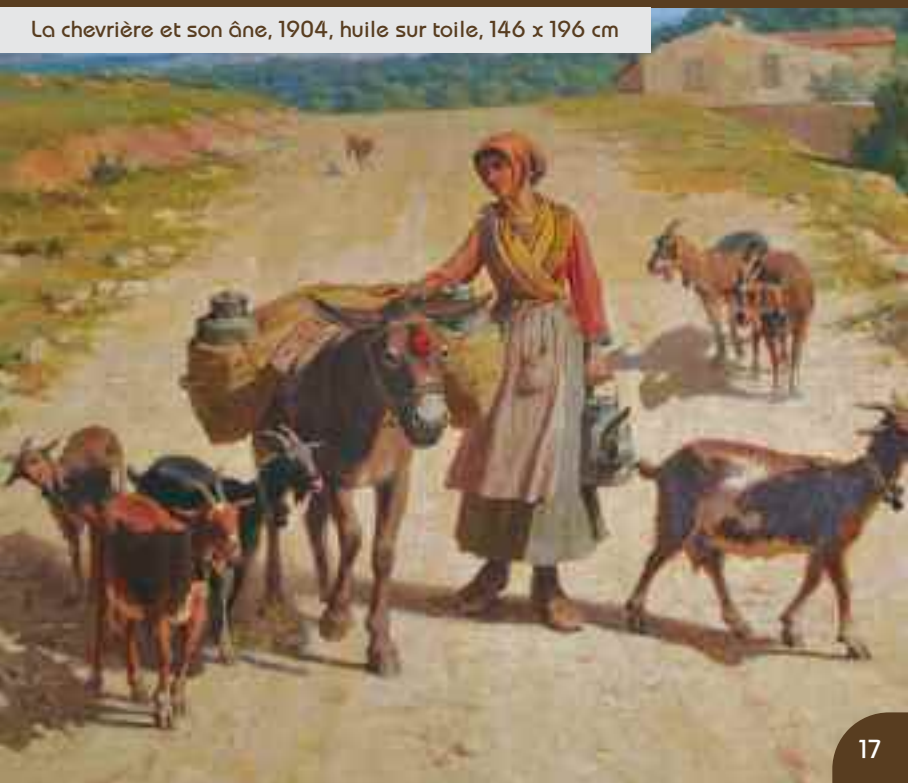
La chevrière et son âne, 1904, huile sur toile, 146 x 196 cm

Cette exposition permanente, essentiellement organisée avec le fonds des collections du Musée de Salon & de la Crau, a été enrichie par des dépôts de l'association de soutien du musée ainsi que de généreux particuliers.